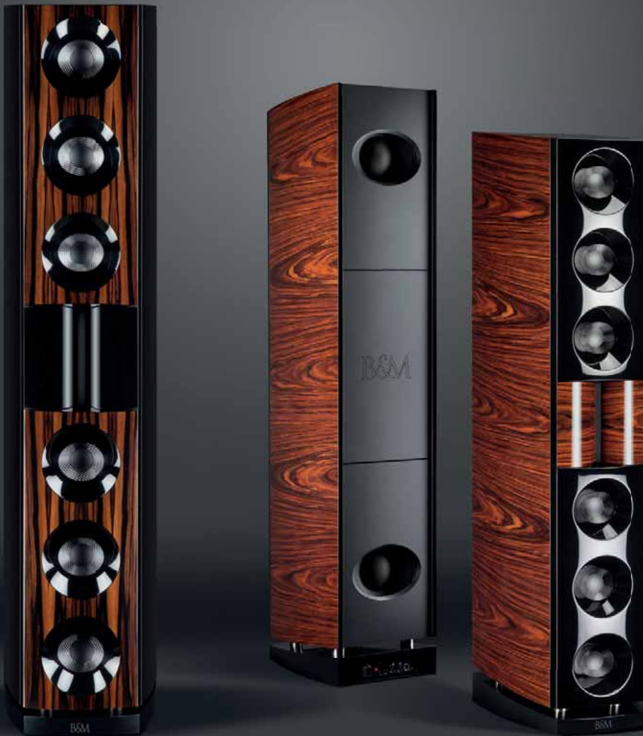
LINIENSTRAHLER BMLINE 35